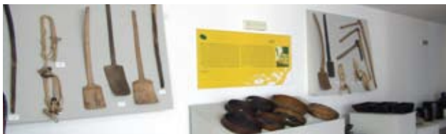
Museu Etnográfico Dr. Louzã Henriques

Atelier da Cerdeira - 933 46 77 29 Loja Aldeias do Xisto de Candal - 239 99 13 93 Lojinha do Talasnico - 967 53 73 75/9 O Retalhinho - 966 90 95 97 Cerâmica, miniaturas das casas serranas (em xisto) Peneiras, crivos e mosqueiros