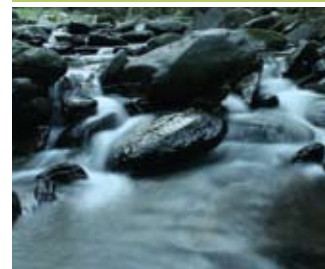
Ribeira S. João