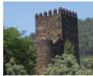
Castelo da Lousã