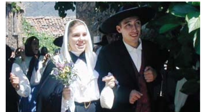
Recriação do Casamento Tradicional

O Castelo da Lousã, também conhecido como Castelo de Arunce, um dos raríssimos construídos em xisto, pertence a uma das primeiras linhas defensivas criadas para controlar os acessos meridionais a Coimbra, na segunda metade do Séc. XI. Em 1124, uma incursão islâmica tomou o castelo e, de acordo com uma lenda antiga, durante este período o Castelo terá sido utilizado pelo chefe árabe para proteger a sua filha Peralta e os seus tesouros após derrotado e expulso de Conimbriga. Ermidas - a ermida da N. Sra. da Piedade está situada no morro fronteiro ao do Castelo. Do seu conjunto de quatro capelas, a mais antiga é a de S. João, erguida no séc. XV. Tem beneficiado de trabalhos de restauro que lhe asseguram o bom estado de conservação e acolhem anualmente várias romarias e festas religiosas. Central da Ermida - a Central Hidroelétrica da Ermida, ainda em funcionamento, foi construída em 1927 para fornecer luz à vila e energia à Fábrica de Papel, e é um testemunho vivo de um passado em que a Lousã era sede de uma intensa actividade industrial. Aldeias Serranas - contrariando a desertificação dos anos 50, actualmente estas aldeias recuperaram para uma nova vida, fruto dos programas de recuperação. As casas têm sido adquiridas por novos proprietários, oriundos sobretudo de grandes núcleos urbanos, que fazem delas residências novamente com vida.