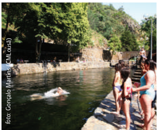
Praia Fluvial da Senhora da Piedade