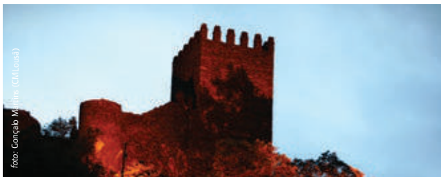
Castelo da Lousã

Loja das Aldeias do Xisto do Candal - 239 991 393 Atelier da Cerdeira - 931 104 018