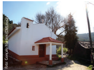
Igreja no Catarredor