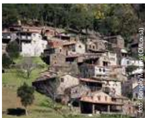
Aldeia do Xisto do Candal

Cabrito Chanfana Serrabulho Serranitos Mel DOP Serra da Lousã Migas Talasnicos