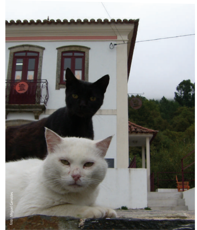
Loja Aldeias do Xisto do Candal

Na Serra da Lousã pode encontrar várias Aldeias do Xisto, que têm vindo a ser alvo de recuperação. A construção das casas é maioritariamente em xisto, a matéria-prima mais abundante na serra, a par com a madeira. Nos dias de hoje, apesar da fraca densidade populacional nas Aldeias, estas são um local de forte atratividade turística. Na envolvente das Aldeias do Xisto existe uma fauna e flora bastante rica. É frequente avistarem-se javalis ou veados. Além da passagem pelos trilhos, pode ainda visitar algumas lojas de comércio tradicional presentes nas Aldeias.