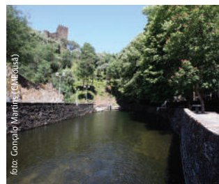
Praia Fluvial da Senhora da Piedade