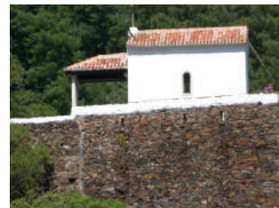
Capela Nossa Senhora da Piedade