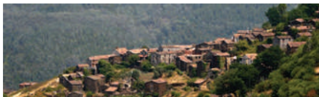
Aldeia do Xisto do Talasnal

Cabrito Chanfana Serrabulho Serranitos Mel DOP Serra da Lousã Migas Talasnicos