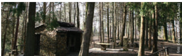
Terreiro das Bruxas

Cabrito Chanfana Serrabulho Serranitos Mel DOP Serra da Lousã Migas Talasnicos