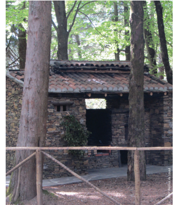
Terreiro das Bruxas

Na Serra da Lousã pode encontrar várias Aldeias do Xisto, que têm vindo a ser alvo de recuperação. A construção das casas é maioritariamente em xisto, a matéria-prima mais abundante na serra, a par com a madeira. Nos dias de hoje, apesar da fraca densidade populacional nas Aldeias, estas são um local de forte atratividade turística. Na envolvente das Aldeias do Xisto existe uma fauna e flora bastante rica. É frequente avistarem-se javalis ou veados. Além da passagem pelos trilhos, pode ainda visitar algumas lojas de comércio tradicional presentes nas Aldeias.